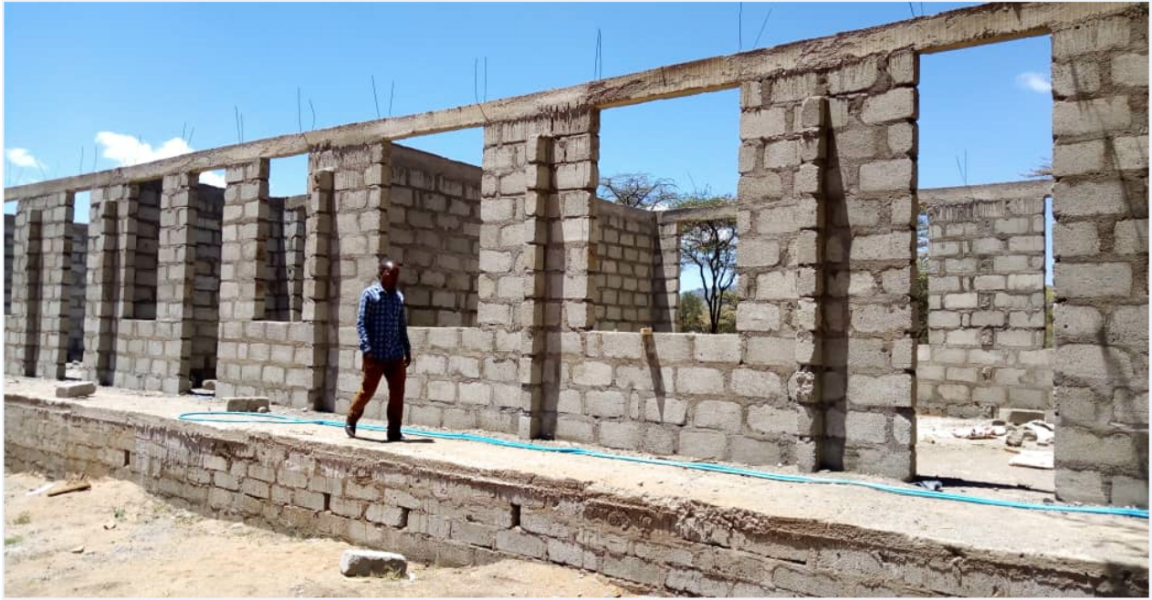
1.3 Picha kuonyesha ujenzi wa madarasa mawilin(2) na ofisi moja katika kiji cha Engarenaibor.

za sekondari kwa ajili ya Kuboresha mazingira ya kujifunzia kwa shule za sekondari katika kata ya Tingatinga na Lekule. Fedha bado hazijatolewa.