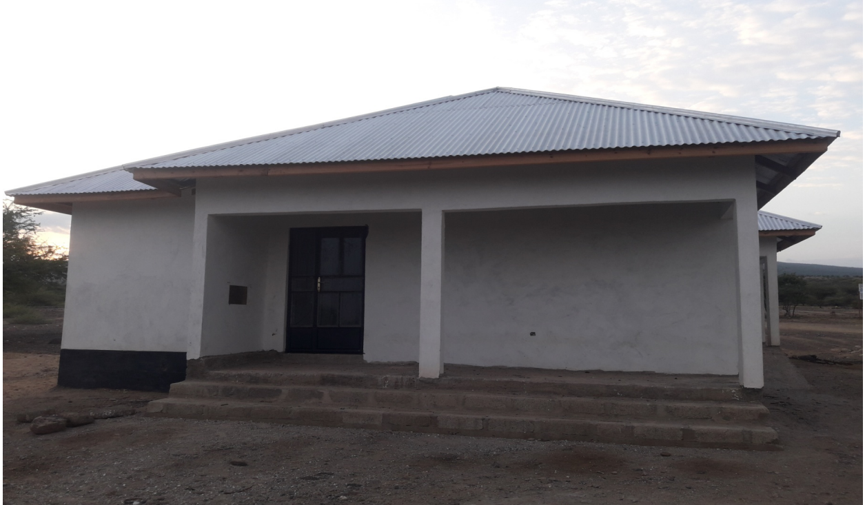
Picha 1.1 :Hatua za Ujenzi wa Ofisi ya Kata ya Noondoto kwa muonekano wa mbele.