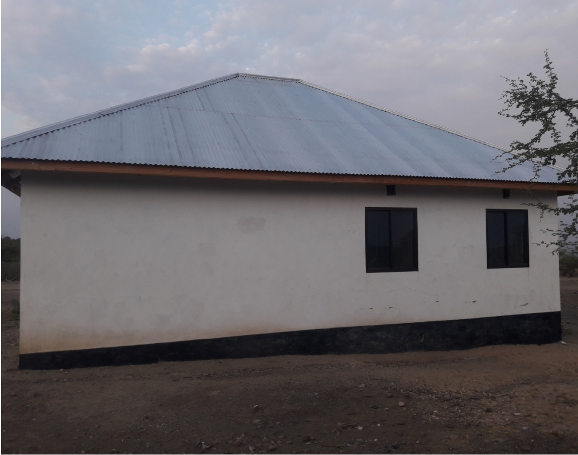
Picha 1.1 :Hatua za Ujenzi wa Ofisi ya Kata ya Noondoto kwa Hatua iliyofikiwa kwa muonekano wa pembeni.