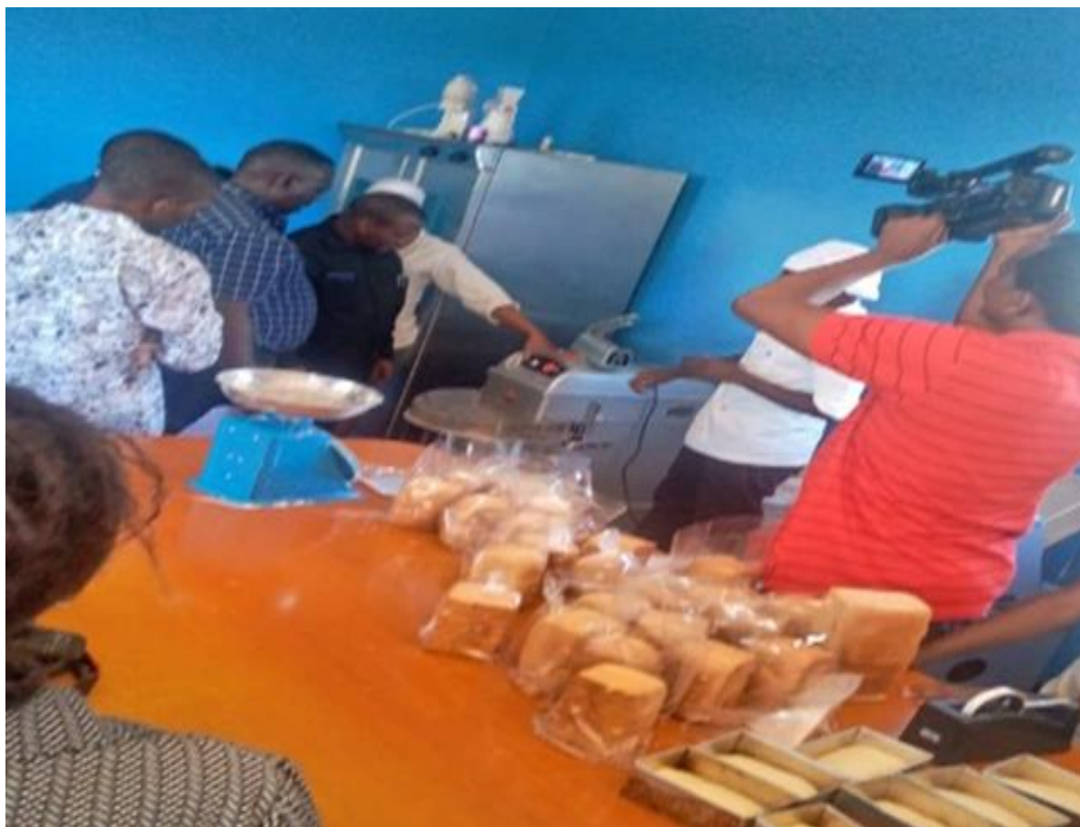
PICHA VIII :KATIBU MKUU TAMISEMI AKIONYESHWA BIDHAA ZA MIKATE KATIKA KIWANDA CHA MIKATE NAMANGA KWA MIKOPO YA WAJASIRIAMALI