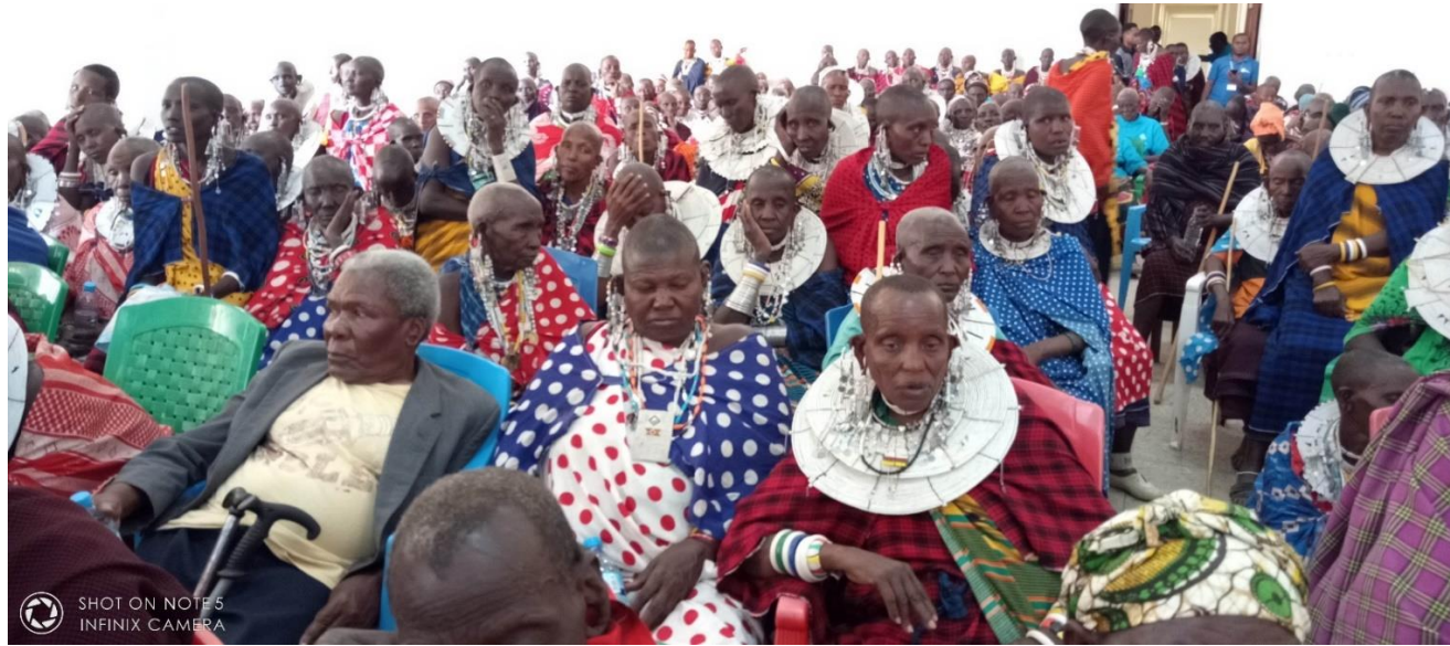
PICHA IX :JAMII YA WAFUGAJI WAKIWA KATIKA MKUTANO WA HADHARA