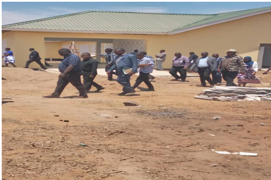
PICHA V: KATIBU MKUU TAMISEMI AKIWA VIONGOZI WENGINE KATIKA KITUO CHA ENGARENAIBOR