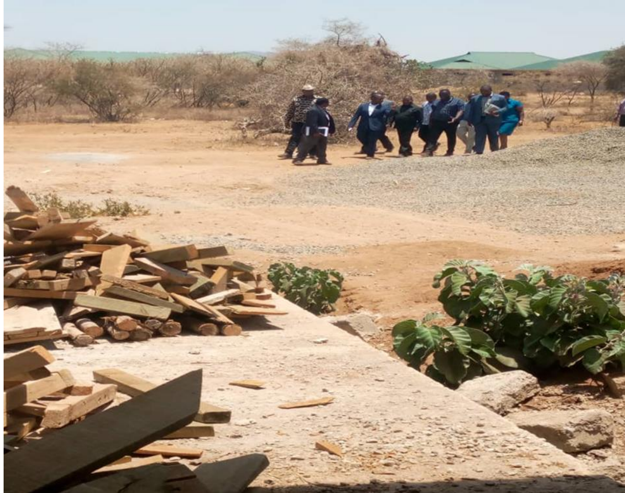
PICHA III: MWONEKANO KITUO CHA AFYA EWORENDEKE