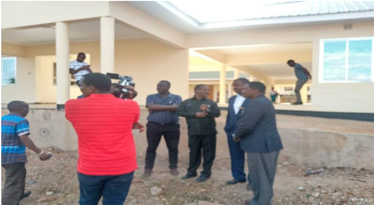
PICHA IV: KATIBU MKUU TAMISEMI AKIWA KITUO CHA ENGARENAIBOR