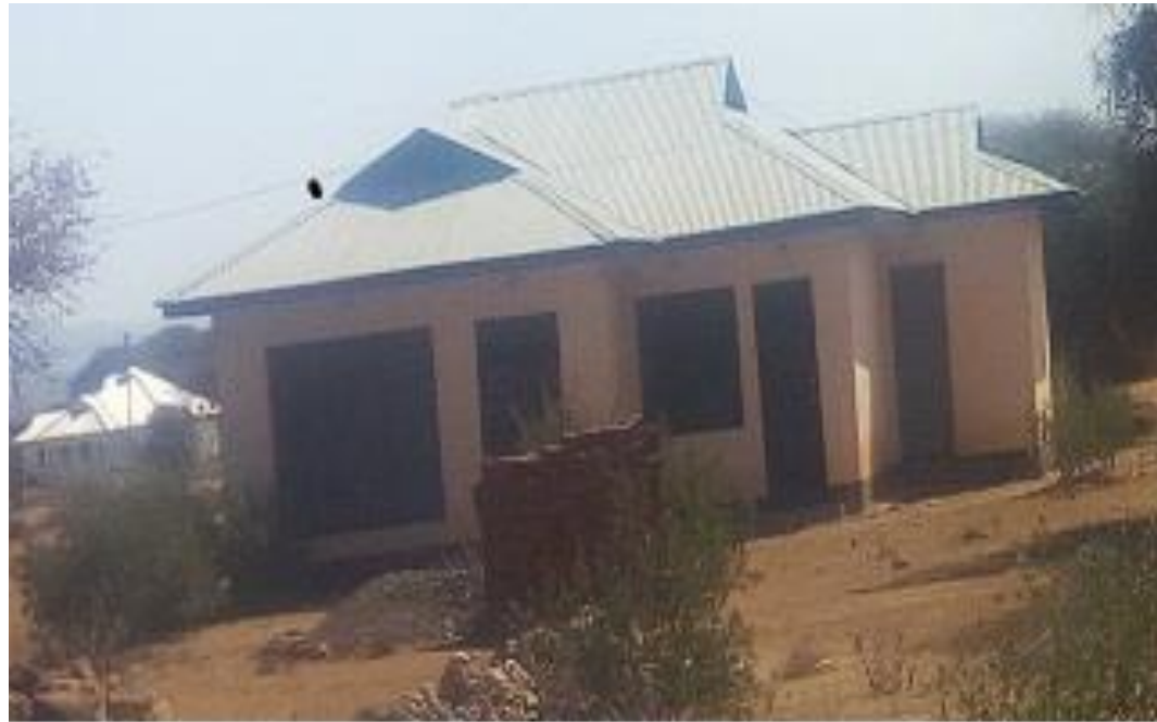
Pichali: Nyumba ya Mwalimu katika hatua ya Mwisho