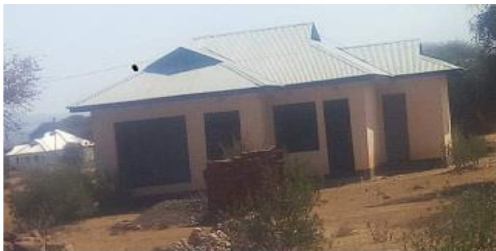
PCHA I: Nyumba ya Mwalimu.