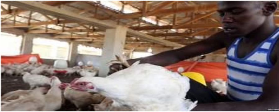
Picha IV: Kuonyesha ufugaji wa kuku kwa mikopo ya Vijana.