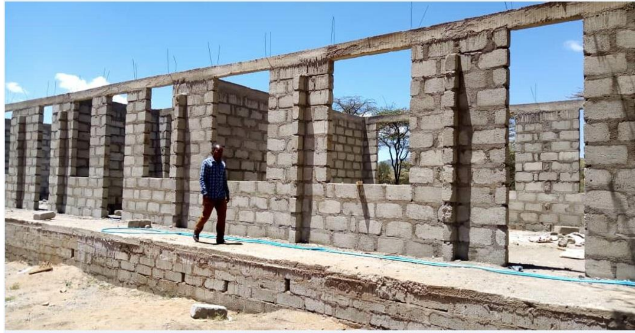
Pichall: Ujenzi wa Darasa katika Shule ya Sekonadari Engarenaior.