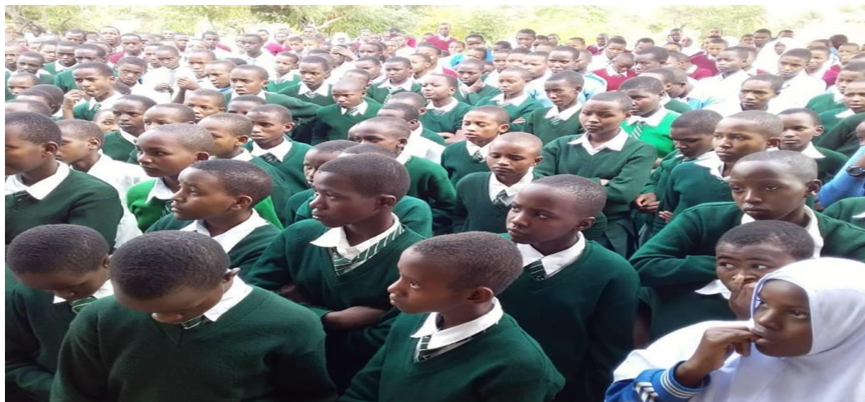
PICHA II: Wanafunzi Wakiwa Kwenye Shuleni